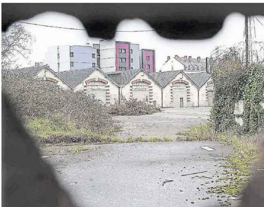
Les anciens entrepôts, en mauvais état, du site des Docks de Mitrie-Sud seront démolis.

E n amont, l'architecte urbaniste François Grether a été missionné par Nantes métropole pour la reconversion urbaine de l'ensemble du secteur des casernes. « La parcelle Mitrie-Sud n'est pas directement reliée au futur site Mellinet. Une voie nouvelle doit permettre de désenclaver le site et de le relier à la rue de la Mitrie », précise Nantes métropole. Le site Mitrie-Sud est actuellement occupé par d'anciennes écuries et entrepôts qui ne seront pas conservés. « Ce projet peut être engagé dans un délai court en complémentarité avec Mellinet. Un anneau vert s'appuiera sur la trame verte