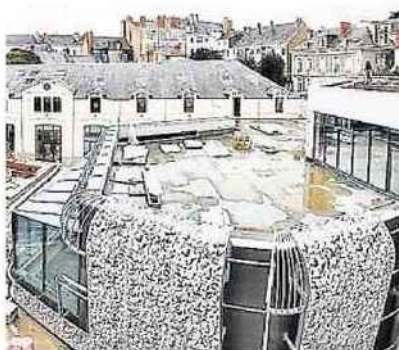
Enet-Dolowy, a signé le Carré Lafayette à Nantes.